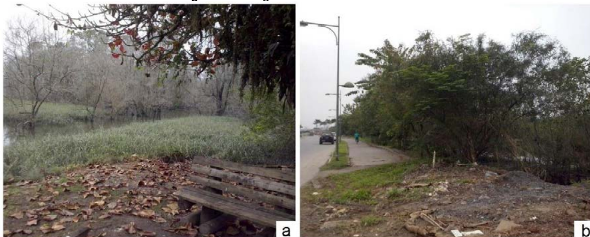
Imagem 5 - Manguezais Na Cidade De Joinville

sua migração (GILMAN, et al., 2008; SCHAEFFER-NOVELLI, et al., 2016). Porém, tal condição está restrita à existência de barreiras físicas. Em Joinville, os ecossistemas de mangues, ao longo da Baía da Babitonga perpassam as áreas rurais, áreas de preservação (Imagem 5a) e áreas urbanas. Nessa última, o mangue encontra-se em parte limitado pela infraestrutura urbana, impossibilitando a migração da flora e fauna (imagem 5b).