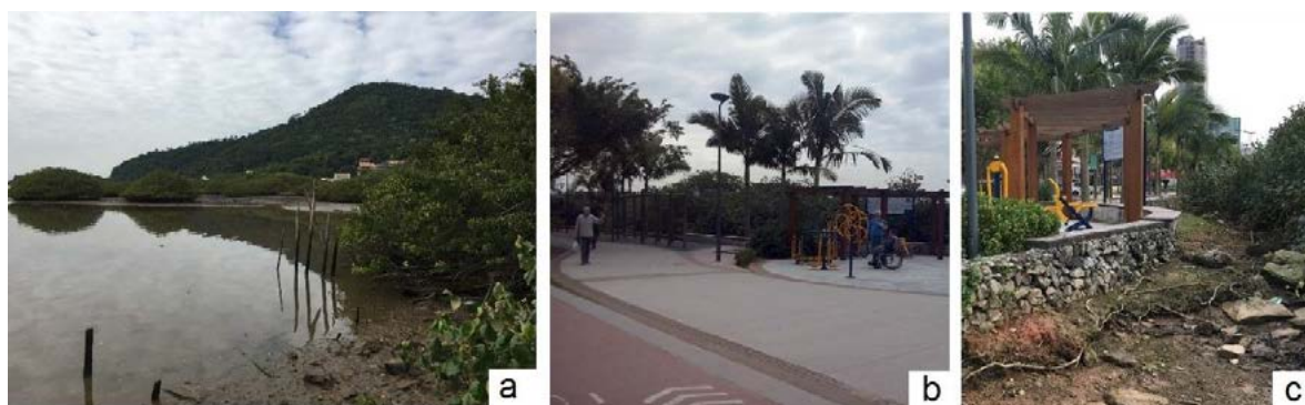
Imagem 3 - (A) Área de Mangue no Bairro Saco da Fazenda em Itajaí, (B) Presença de Elementos de Lazer, como Parques, Quadras de Esportes, Ciclovias e Faixas para Pedestres (C) Pequenas Erosões ao Longo do Limite Entre As Áreas

O limite entre o ecossistema natural (mangue) e a urbanização da área é delimitado por uma estrutura de muro com pedras, como forma de contenção. Conforme pode ser observado, na imagem 3c, a dinâmica do sistema natural já está interferindo na estrutura de contenção, iniciando pequenas erosões ao longo do limite entre as áreas.