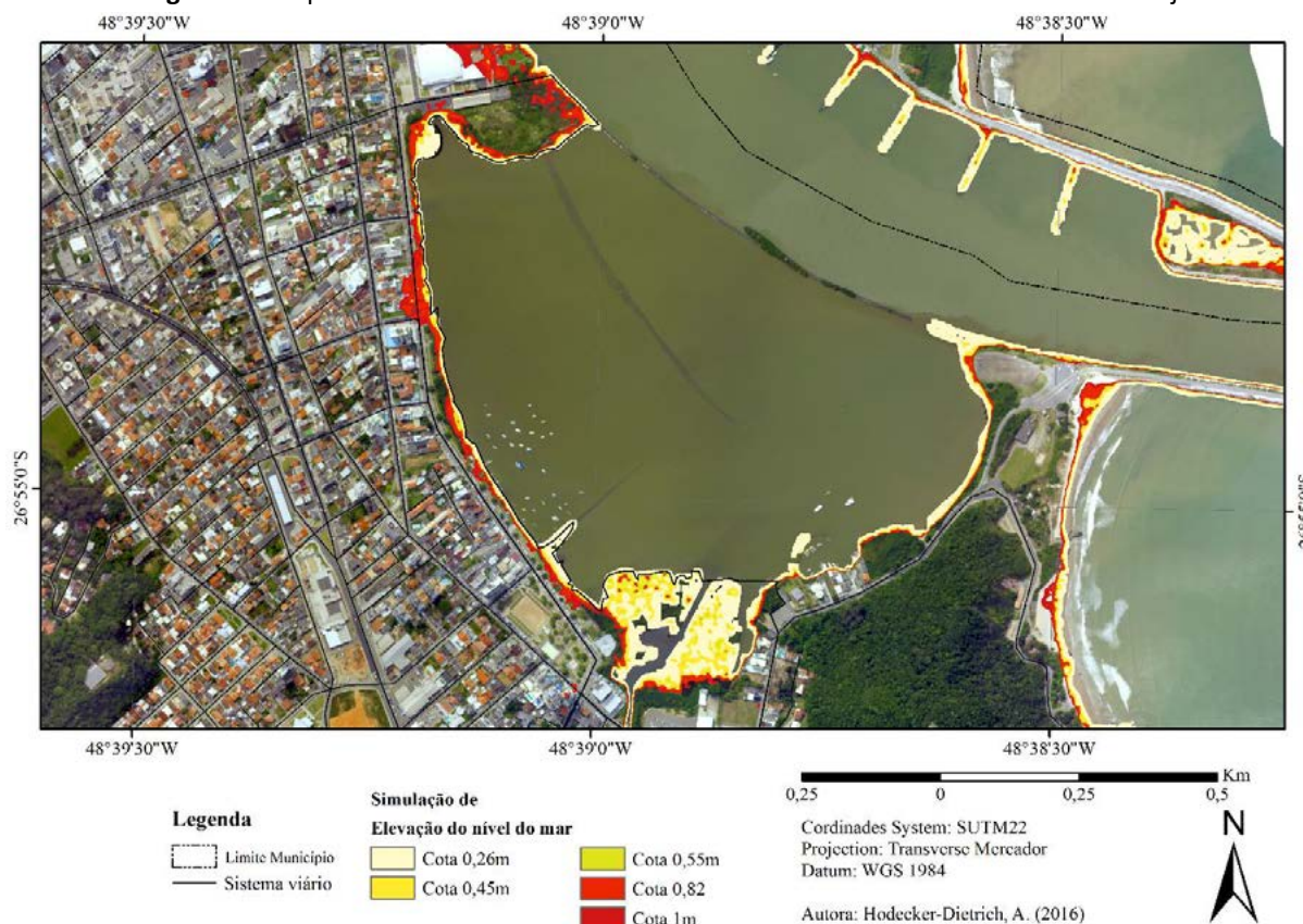
Imagem 2 - Mapeamento de Aumento do Nível do Mar no Bairro Saco da Fazenda em Itajaí.

O Saco da Fazenda surge de intervenções de obras de engenharia que ampliaram artificialmente a sua área. Conhecida como uma região tradicional, que se desenvolveu rapidamente, atualmente abrange a rota gastronômica, o Centro Eventos, a Associação Náutica e a Área de Proteção Ambiental do Saco da Fazenda 15 .