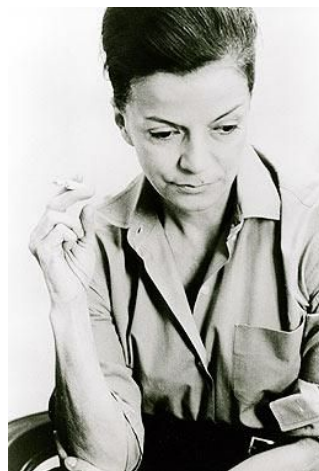
Figura 8 - Lygia Clarck (1920-1988)

Desenvolvi no ensino médio, durante o 1º semestre de 2011, um projeto de estágio que trouxe em seu contexto a linguagem da escultura, durante os vários períodos na história da arte e oportunizou aos alunos o conhecimento sobre a artista Lygia Clarck. Dessa forma procurei propiciar a reflexão sobre vários períodos da história da arte até chegar ao contemporâneo, questionando os materiais usados hoje e as técnicas que Lygia traz na construção dessas obras.