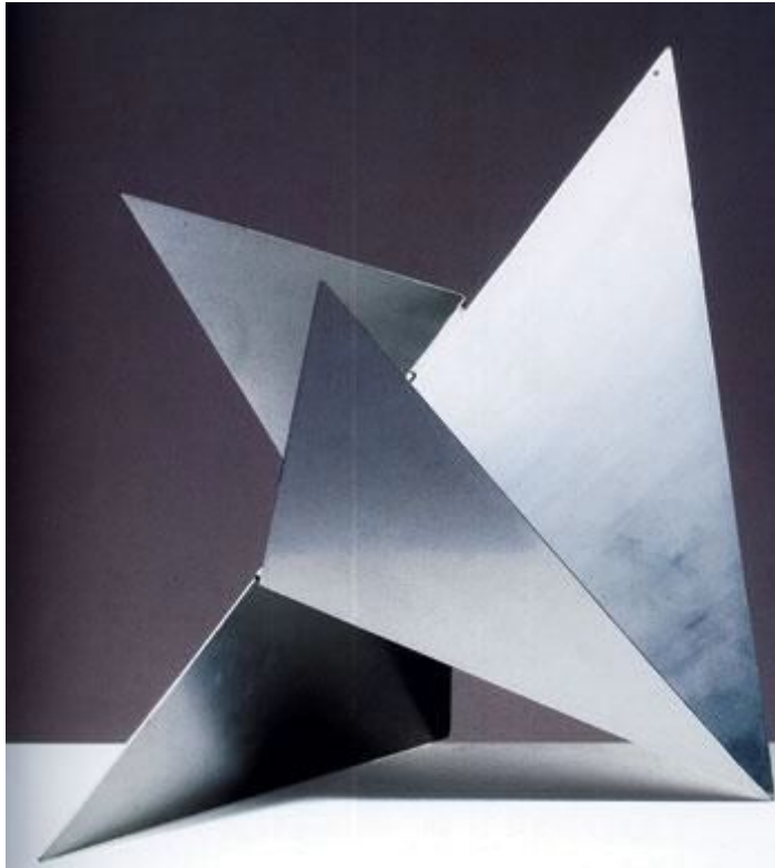
Figura 9 - “Série bicho” Artista Lygia Clarck

Dando continuidade ao projeto desenvolvi uma atividade que também relacionava a artista Lygia Clarck e uma de suas obras à “Série bichos”.