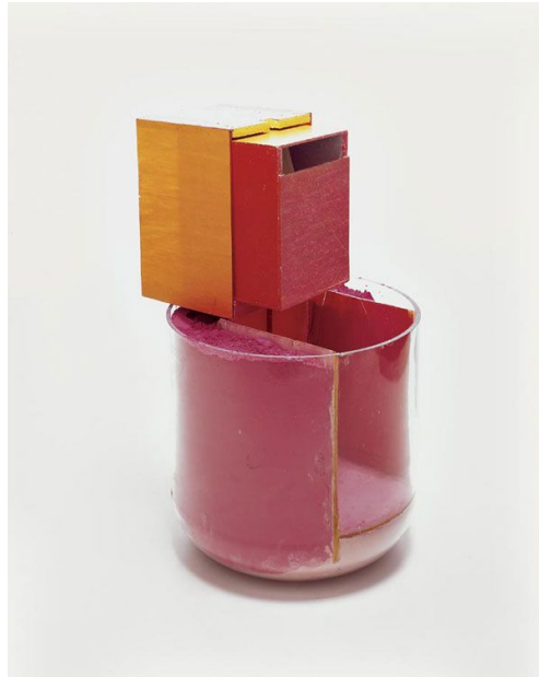
Figura 3 - Bólides – Hélio Oiticica