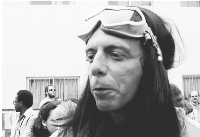
Figura 1- Hélio Oiticica (1937- 1980)

artista em questão: Hélio Oiticica. Observamos a identidade do artista em suas obras, onde traz seus pensamentos e vivencias cotidianas.