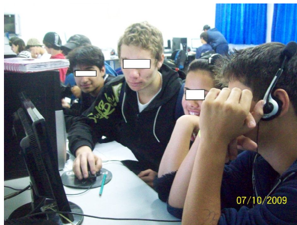
Figura 5 – imagem do estágio supervisionado no ensino fundamental séries finais

Em diversos encontros me deparei com falas e atitudes que me surpreenderam ocasionando uma reflexão constante em todo o processo. Em um desses momentos, pesquisamos sobre algumas obras de Hélio Oiticica na sala de informática: sugeri que a turma se dividisse em grupos e cada grupo pesquisasse sobre uma daquelas obras.