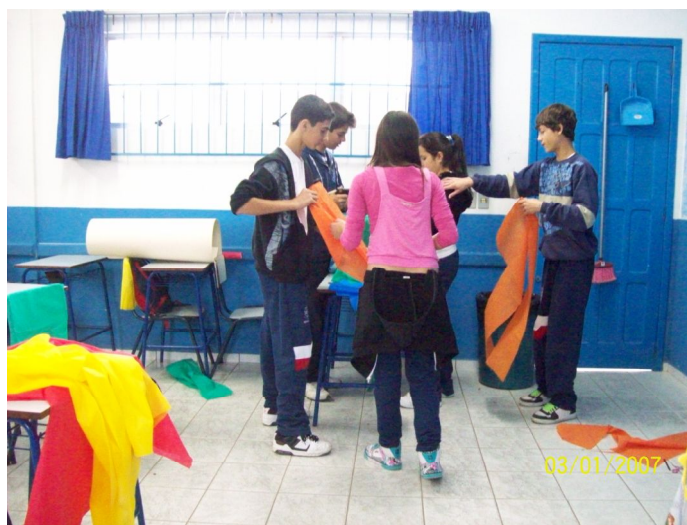
Figura 7 – imagem do estágio supervisionado no ensino fundamental séries finais. Alunos produzindo suas performances baseadas no parangolés.