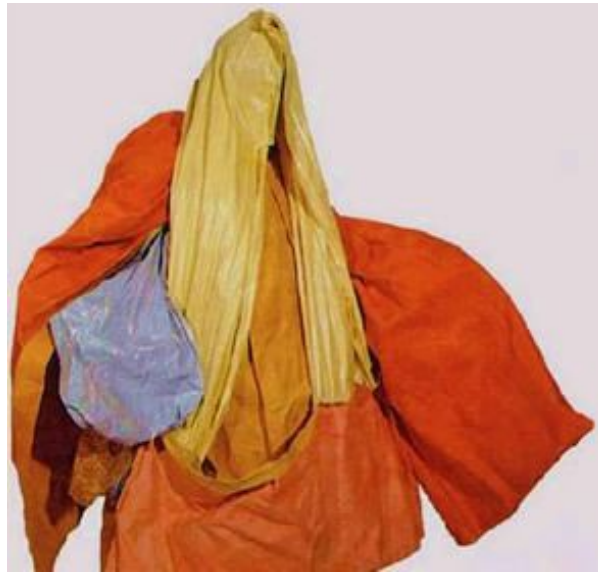
Figura 6 - Performance parangolés de Hélio Oiticica