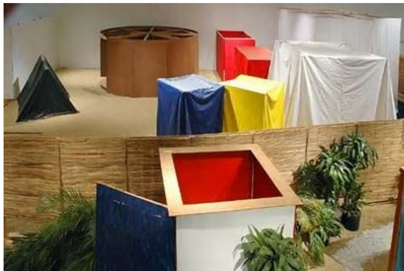
Figura 2 - Tropicália – Hélio Oiticica

http://catracalivre.folha.uol.com.br/2010/02/helio-oitica >